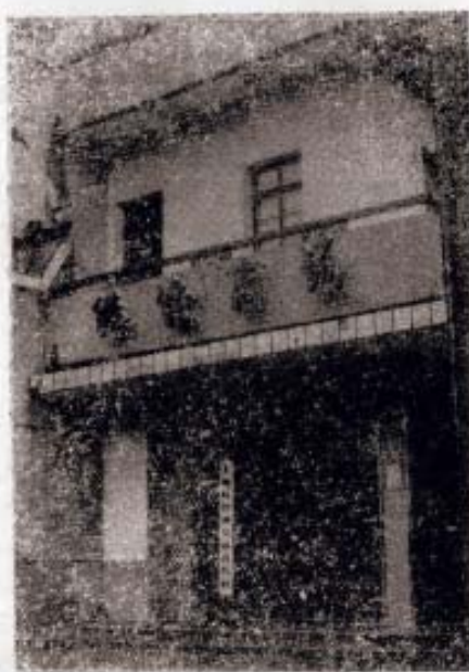
▷ 浙海供销合作社置商场