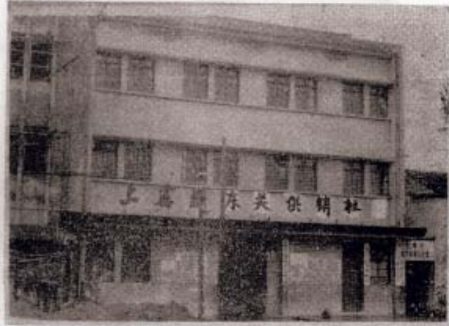
▷东关供销合作社办公楼