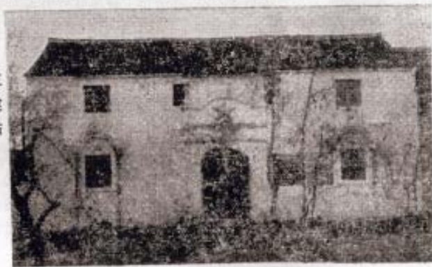
▷ 1951年通泽供销社三溪江头社员为供销社建造的叶（木）柴收购站