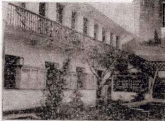
△嵯厦供销合作社办公楼