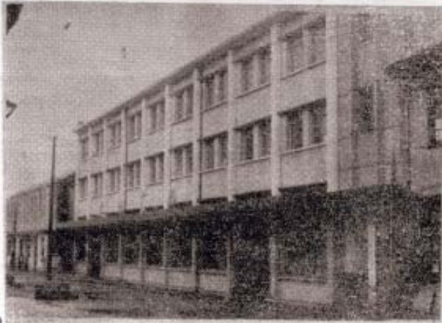
◁谢塘供销合作社暨商场