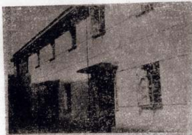
◁ 汤浦供销合作社办公楼