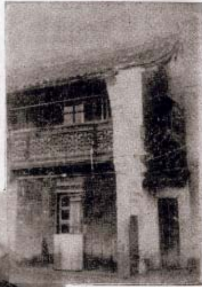
小越生产消费合作社原址▷