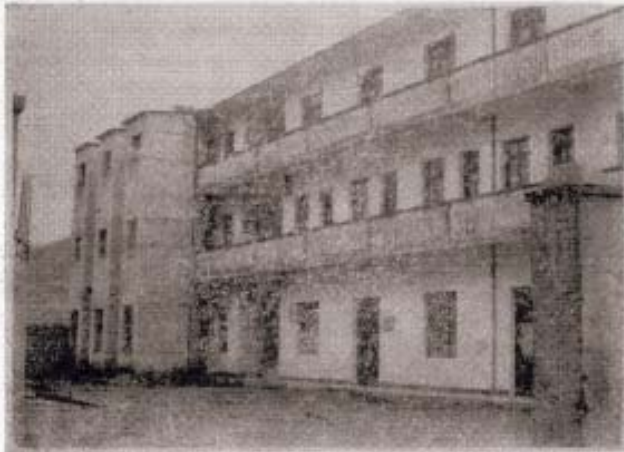
◁下管供销合作社办公楼