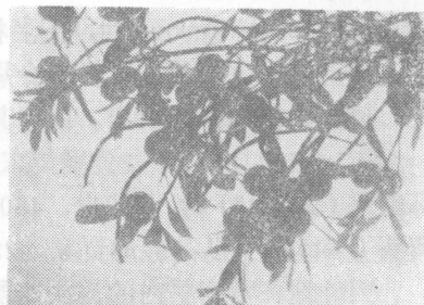
喜摘二都杨梅

公社的农用机械不断增加，到1981年，全社拥有农机总动力2800.8马力，其中耕作机械599马力、排灌机械623马力、收获机械156马力、农副产品加工机械887.7马力。主要农机具有中型拖拉机2台、手扶拖拉机45台、机电动打稻机151台、农用水泵和潜水泵131台。